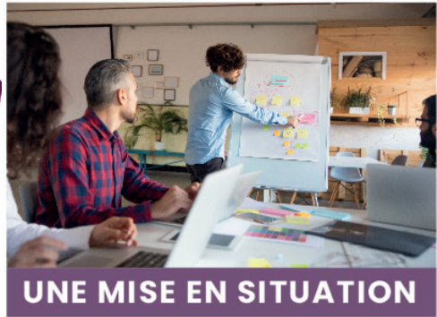
UNE MISE EN SITUATION