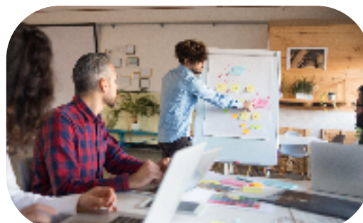
UNE MISE EN SITUATION